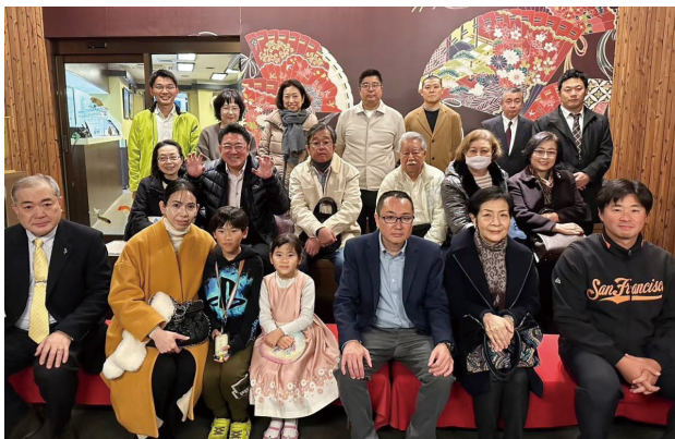
参加者全員での記念写真

令和5年12月11日(月)に大井東支部懇親会を「屋形船 船清」で開催、20名の方にご参加をいただき大盛況でした。新型コロナウイルスも落ち着きコロナ前の高揚感が漂うなか、美味しいお料理とお酒をいただき、会話もはずみあつという間の2時間でしたが楽しい時間を過ごしました。