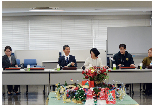
昼食会は税務署の方とともに

令和5年12月11日(月)、品川法人会館において女性部会の税務研修会が開催されました。