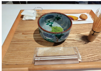
お点前体験をしました

晴天に恵まれた令和5年12月7日(木)に青年部会年末研修会が開催されました。最初の研修先である八芳園では、八芳園自慢の日本庭園を案内していただきました。