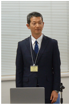
講演される辻副署長