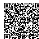
主税局HP（個人住民税の寄附金税額控除）