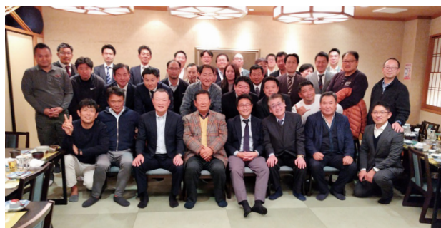
だら毛にて撮影した集合写真