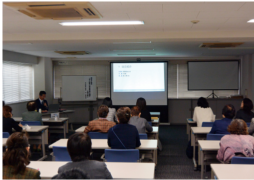
税務研修会の様子