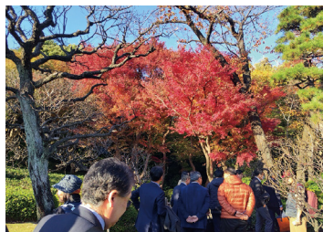
日本庭園を散策しました