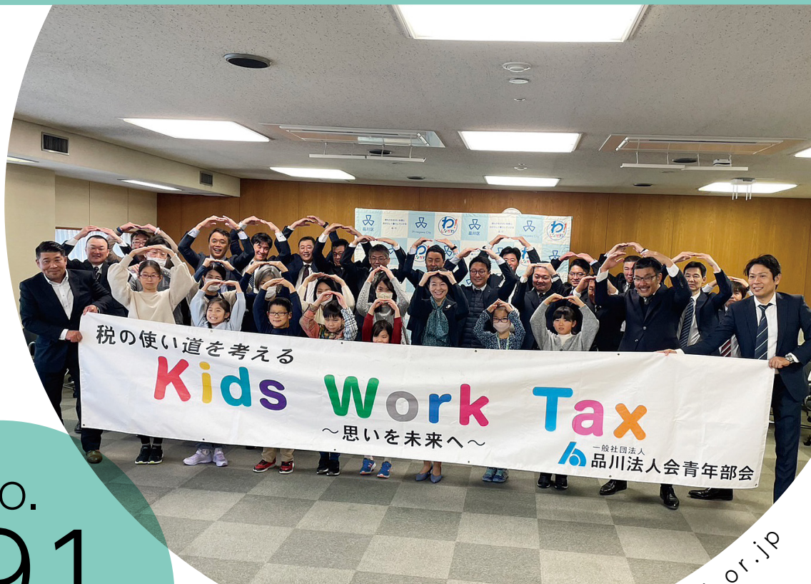
Kids Work Tax贈呈式の様子