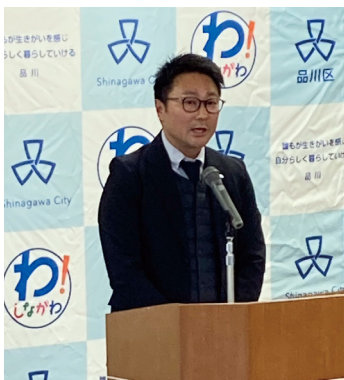
挨拶をする唐澤青年部会長

なお、当日はケーブルテレビ品川の撮影のほか、品川区のホームページにも取り上げていただいています。