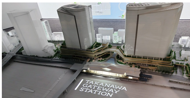
先進的な都市開発について学びました